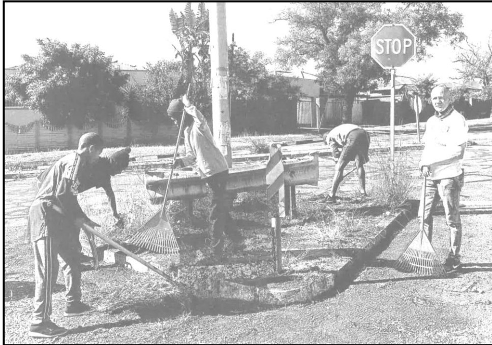
[Sunday Times, 26 Moranang 2020]