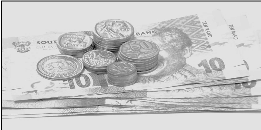
[Se qotsitse le ho lokiswa ho tswa ho www.black and white pictures ]