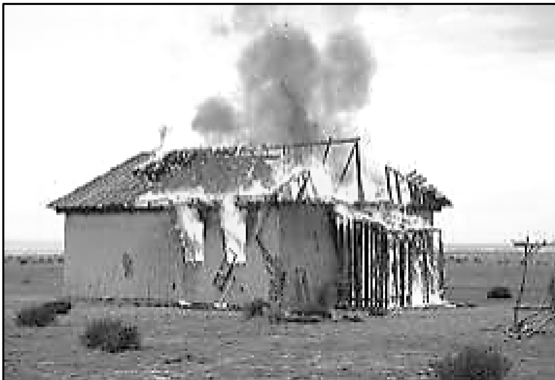
[Setshwantsho sena se nkuwe ho tswa ho Google]