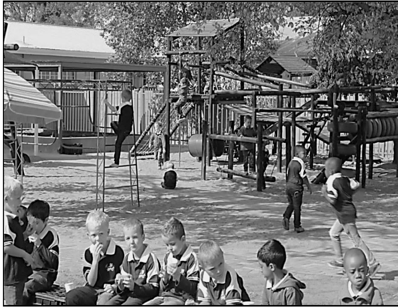
[Setshwantsho se qotsitse ho Google, Windows Live Picture Gallery]