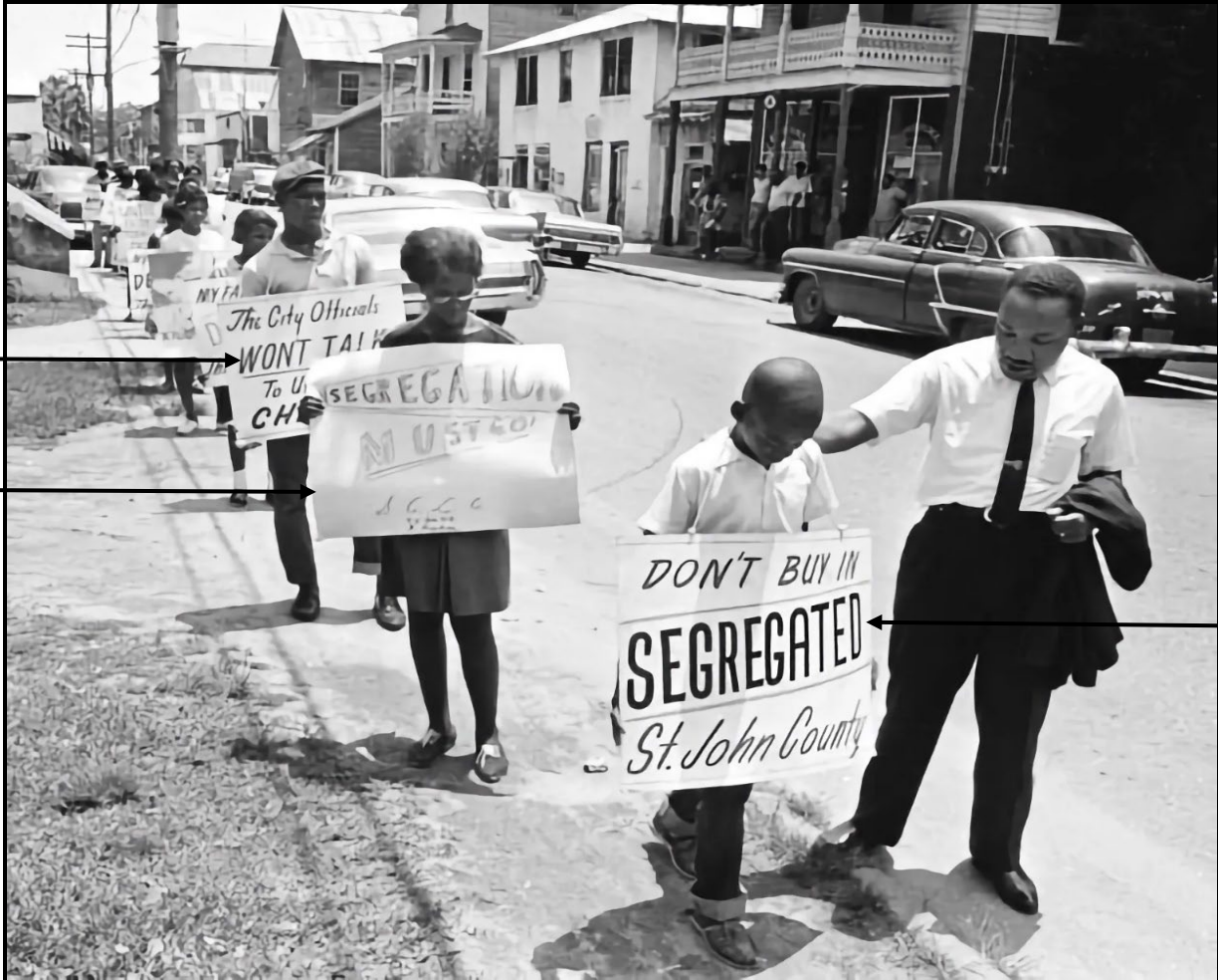
[Uit https://steadyhq.com/en/blackhistory/posts/19bc41d7-0297-4f98-abf4-a17bea49bff3 . Toegang op 27 Julie 2024 verkry.]

Die foto hieronder is uit die Black History Buff -podsending. Dit toon Martin Luther King Jr. saam met sommige van die kinders en jongmense wat op 2 Mei 1963 aan die Kinderoptog ('Children's March') in Birmingham, Alabama, deelgeneem het.