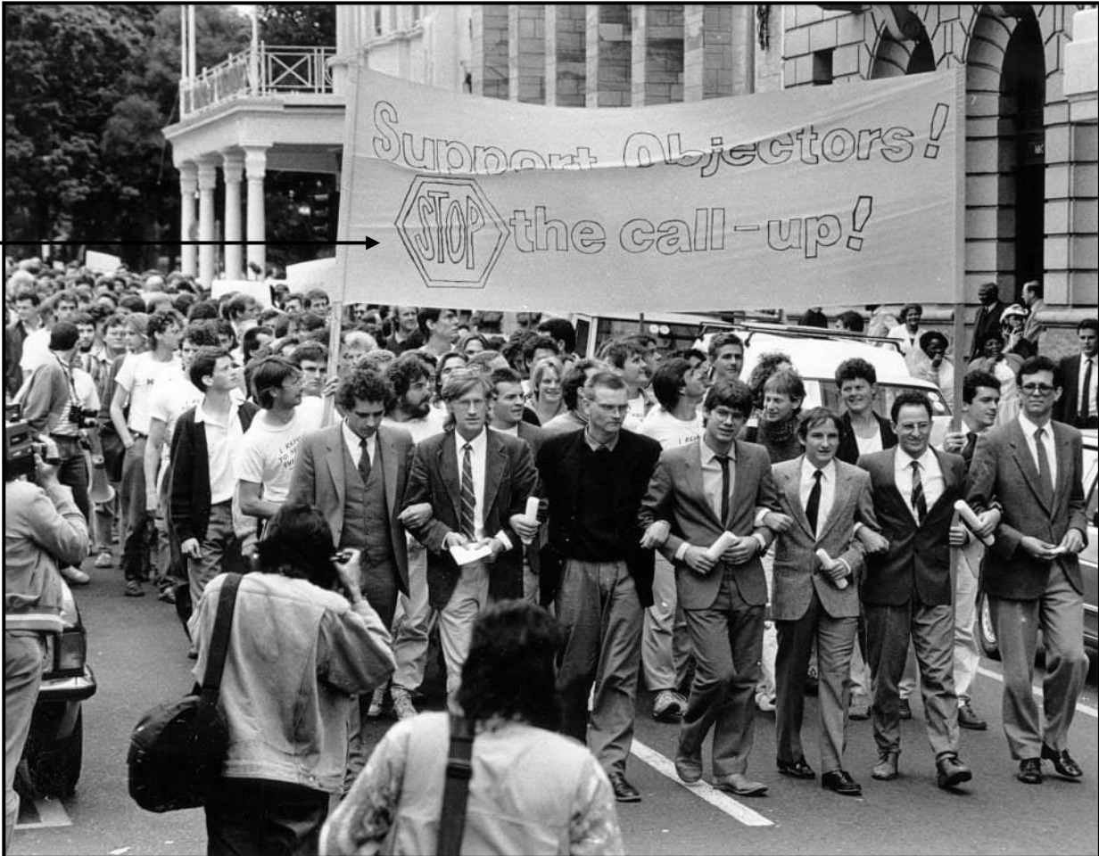
[Uit https://www.news24.com/news24/opinions/columnists/guestcolumn/opinion-glenn-bowles-why-i-conscientiously-object-to-whitewashing-of-de-klerks-apartheid-crimes-20211118 . Toegang verkry op 23 Februarie 2023.]

Die foto hieronder is op 20 Oktober 1989 in Kaapstad geneem. Dit toon lede van die Veldtog Ten Gunste van die Beëindiging van Diensplig (ECC) in 'n optog. Hulle dra die verpligte oproepdokumente vir militêre diens wat hulle by die plaaslike weermaghoofkwartier, die Kasteel, wou oorhandig.