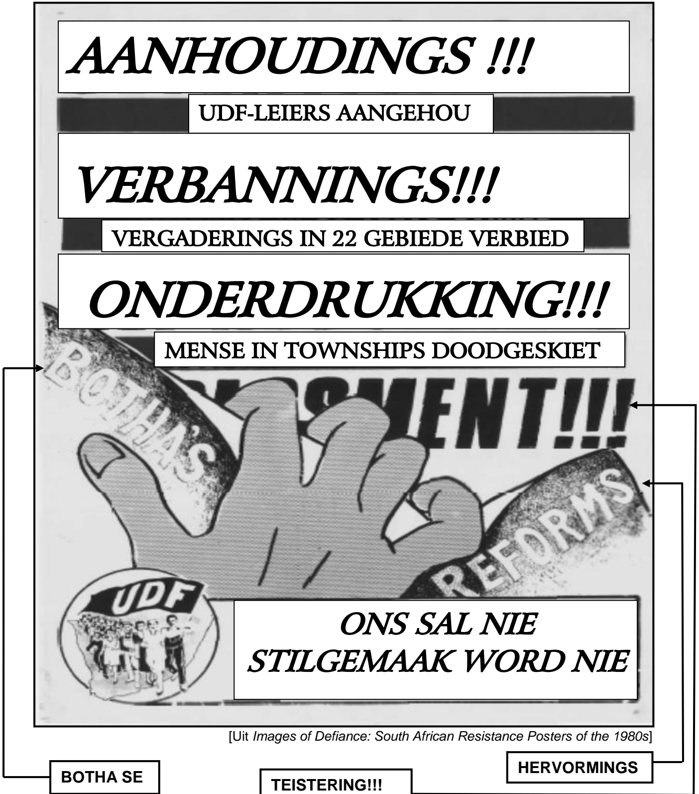
[Uit Images of Defiance: South African Resistance Posters of the 1980s]

Die plakkaat hieronder is in die 1980's deur die United Democratic Front (UDF) gepubliseer. Dit toon sy verbintenis tot verset teen die onderdrukkende maatreëls van die staat.