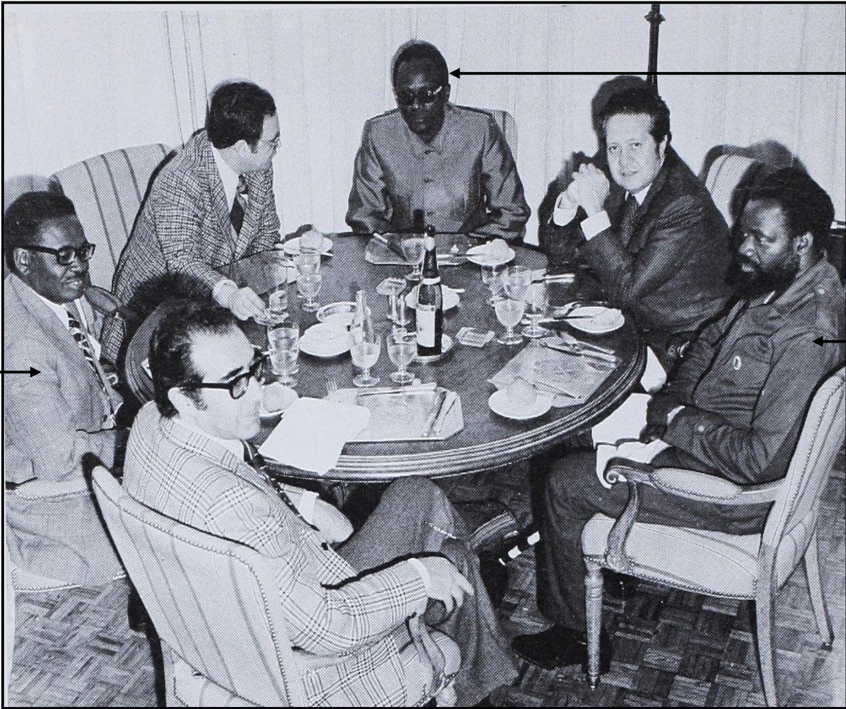
[Uit Accoord verluier teenstellings , Angola Bulletin , Vol. 13, No. 2, deur Angola Comité]

Die foto hieronder is tydens die Alvor Ooreenkoms geneem wat op 15 Januarie 1975 in Alvor, Portugal, plaasgevind het. Voor is die Portugese Minister, Almeida Santos, links van hom is Aghostino Neto, dan 'n Portugese amptenaar gevolg deur Holden Roberto, gevolg deur 'n Portugese amptenaar, Soares, en langs hom Jonas Savimbi.