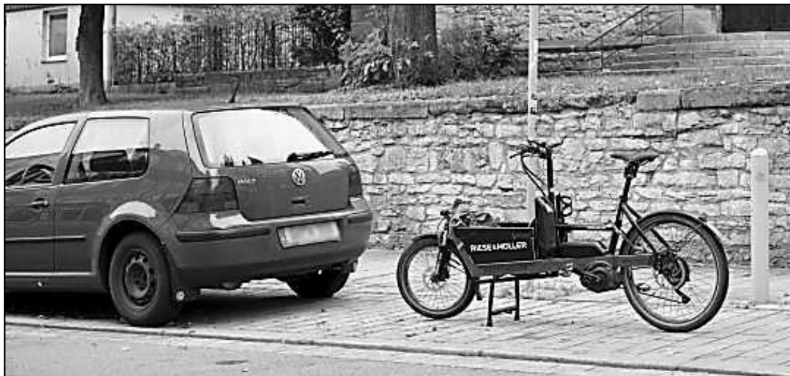
Das Lastenfahrrad ist viel kleiner als ein Auto